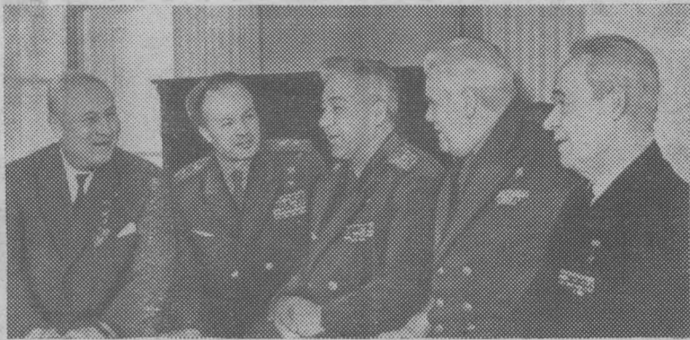
НА СНИМКЕ: первые Герои Советского Союза летчики полярной авиации (слева направо): М. Т. Слепнев, Н. П. Каманин, А. В. Ляпидевский, М. В. Водопьянов и В. С. Молоков, принимавшие участие в спасении челюскинцев.

В августе 1933 года советский пароход «Челюскин» вышел из Мурманского порта, имея задание пройти за одну навигацию по трассе Северного морского пути из Мурманска во Владивосток. Такая попытка на судне неледокольного типа предпринималась впервые.