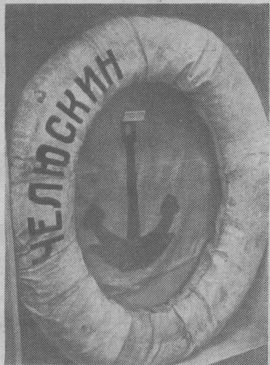
Спасательный круг с корабля, находящийся в экспозиции Музея Арктики и Антарктики.

В августе 1933 года советский пароход «Челюскин» вышел из Мурманского порта, имея задание пройти за одну навигацию по трассе Северного морского пути из Мурманска во Владивосток. Такая попытка на судне неледокольного типа предпринималась впервые.