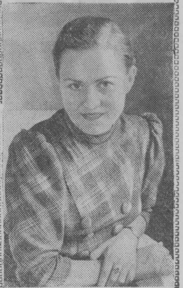
Сегодня исполнилось 60 лет со дня рождения [1904] Саломеи Нерис [Бачинскайте-Бучене], выдающейся литовской советской поэтессы. Умерла в 1945 году.