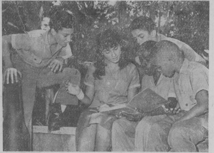
Правительство Кубы уделяет огромное внимание детям. Оно заботится о том, чтобы дать им общее образование, о том, чтобы юные граждане острова Свободы были всесторонне раз-

витыми и культурными людьми. В стране созданы школы, в которых юноши и девушки могут заниматься музыкой, живописью, драматическим искусством, балетом.