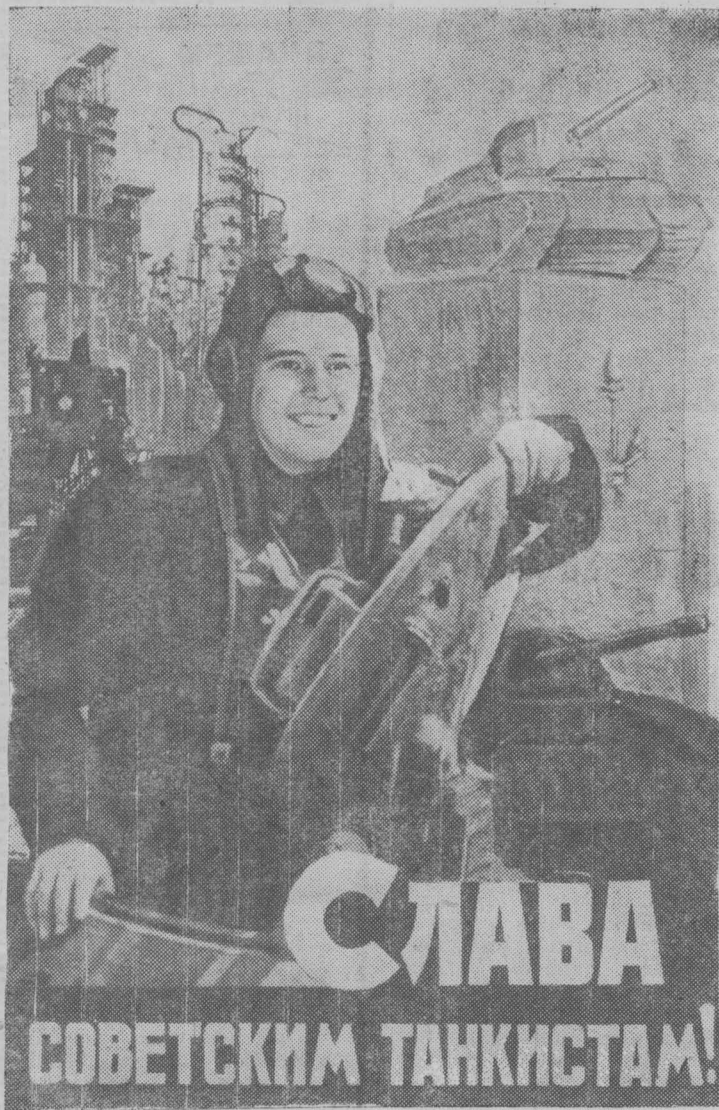
Плакат художника Б. Антонова.