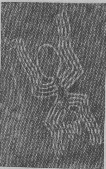
НА СНИМКЕ: загадочный рисунок долины Наска, сделанный с самолета.

Древние жители Южной Америки — народ Солнца, как они себя называли, поклонялись Солнцу, Луне, планетам и всякого рода космическим силам. И вполне вероятно, что в долине гигантских рисунков у них были