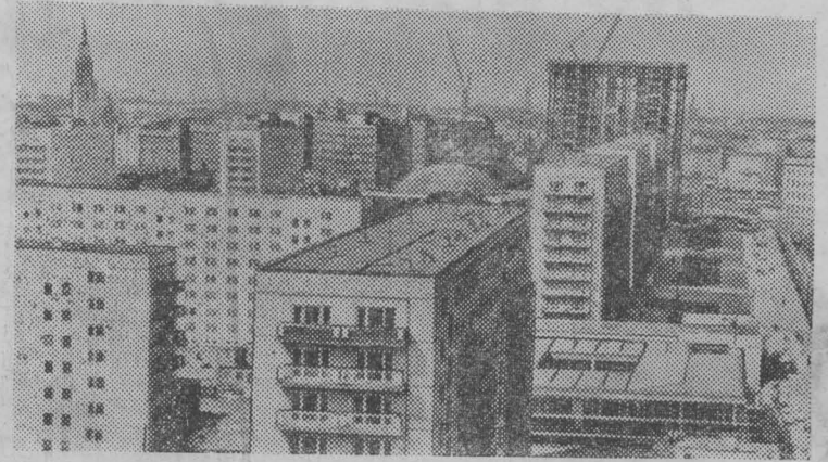
Германская Демократическая Республика. Берлин. Неузнаваемо изменила свой облик центральная магистраль города Карл-Маркс-Алле. Когда-то здесь стояли старые и полуразрушенные дома. За последние годы по обеим сторонам улицы выросли многоэтажные здания, в большинстве которых живут новоселы.