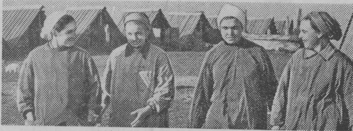
Алтайский край. Коллектив Беловского свиновосхоза год назад достиг рубежа—75 и 16». Но животноводы не успокоились на этом. На фермах еще шире развернулось движение «тысячниц». В соревнование включились все свиноводческие фермы. Они обязались вырастить 30 тысяч поросят.