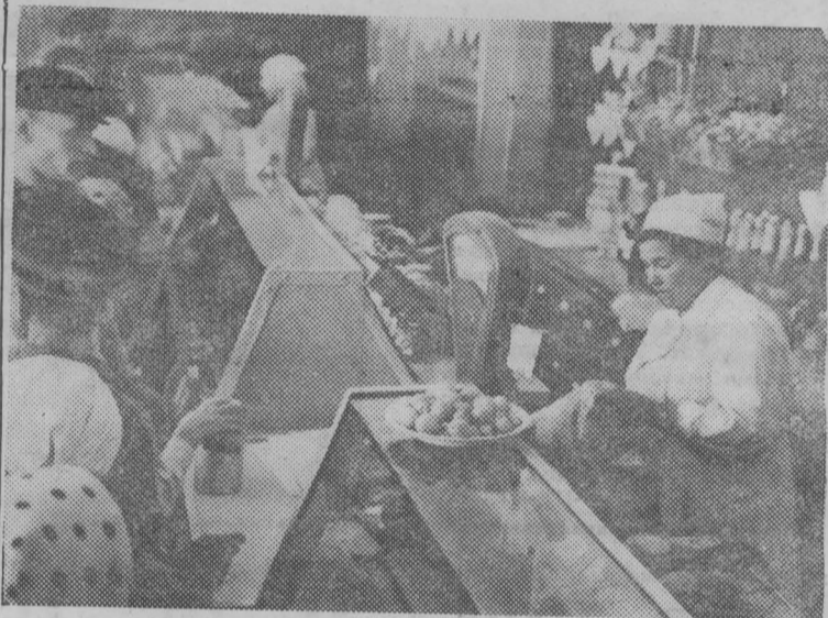
НОВОСИБИРСКАЯ ОБЛАСТЬ. С каждым годом улучшается быт рабочих совхоза № 1. В поселке появились новые жилые дома, школа, детский сад и ясли, радиоузел. Недавно жители поселка сделали первые покупки в открывшемся магазине продовольственных товаров.