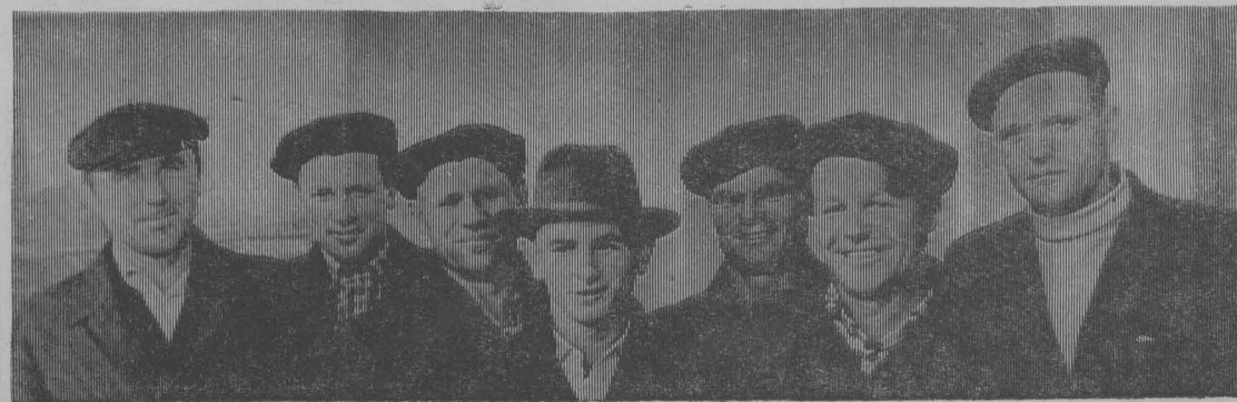
НА СНИМКЕ: Группа механизаторов совхоза «Заря»—участников совещания.

Нет сомнения, что механиз- аторы колхозов и совхозов Промышленновского управле- ния, широко развернув социа- листическое соревнование, обе- спечат успешное проведение уборки урожая 1963 года.