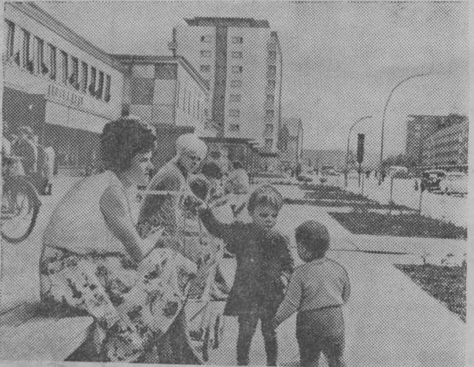
Полны света и воздуха широкие улицы молодого промышленного центра Германской Демократической Республики Эйзенхюттенштадта. Хорошо живется здесь детям. Об их счастливым детстве позаботились родители—создатели и рабочие большого металлургического комбината «Ост» строители социалистического города.