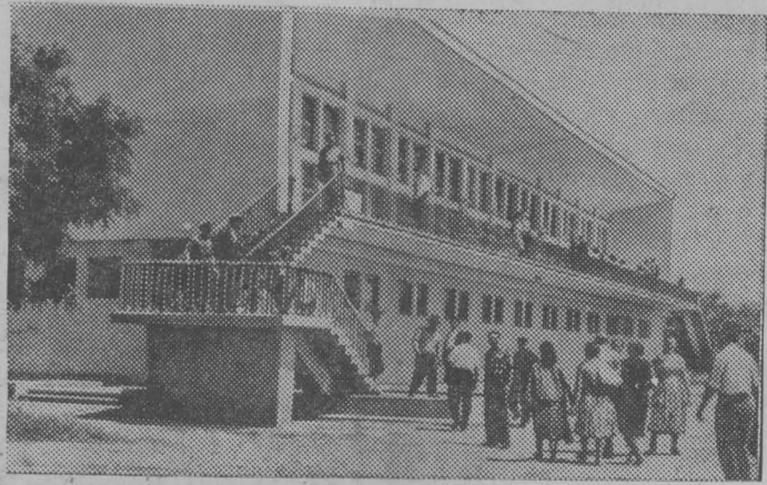
Большую заботу проявляет правительство Румынской Народной Республики о здоровье трудящихся. Из года в год улучшаются условия отдыха, расширяются и благоустраиваются здравницы страны. Сейчас в республике 130 курортов, НА СНИМКЕ: один из домов отдыха на курорте Амара.