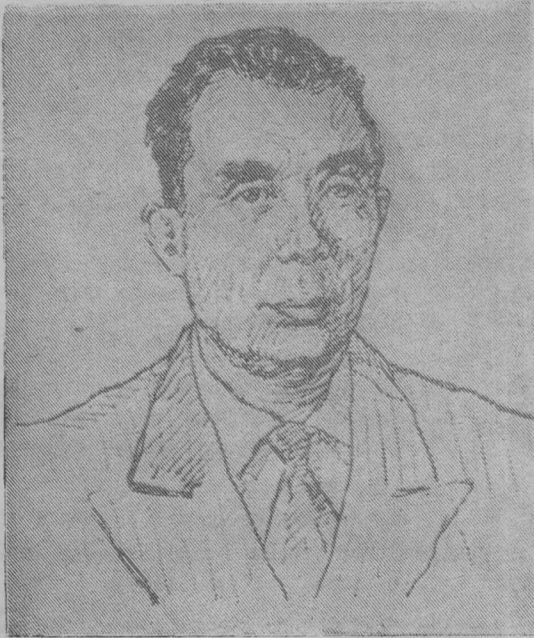
Рис. И. Терехова.

водил по стальным магистралям электровозы. Он долгое время был председателем товарищеского суда, народным заседателем, членом партийного бюро. Награжден орденом Трудового Красного Знамени, несколькими медалями.