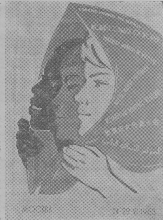
В Москве с 24 по 29 июня будет проходить Всемирный конгресс женщин. НА СНИМКЕ: эмблема Всемирного конгресса женщин.

Обработку пропашных нужно провести в самые лучшие агротехнические сроки и с отличным качеством. Приложим все усилия к тому, чтобы выиграть второй этап борьбы за высокий урожай.