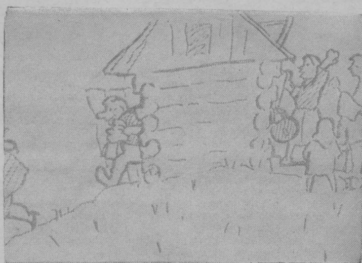
Рис. И. Терехова.

на Большакова одна за другой начали прогуливать около закрытого магази-