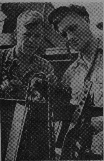
Краснодарский край. Труженики сельского хозяйства Кубани досрочно выполнили план сдачи и продажи хлеба государству, засыпав в закрома Ро-