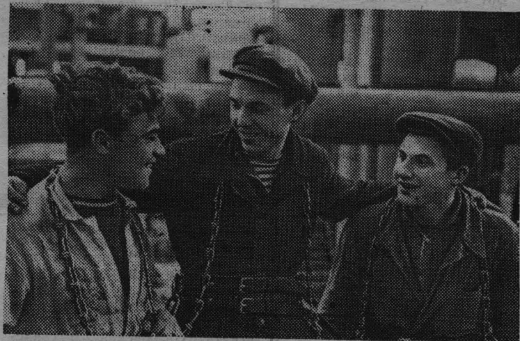
Саратовская область. Сооружение Балашовского сахарного завода вступило в предпусковой период. Строители решили к середине июля нынешнего года закончить монтаж оборудования и стальных конструкций. Гем самым уже в этом году будет обеспечена переработка сахарной свеклы нового урожая. Среди передовиков стройки выделяется бригада монтажников-верхолазов, руководимая

Возвращались из Москвы с желанием поскорее сказать своим товарищам: «Включайтесь в коммунистическое соревнование. Давайте вместе, в едином строю идти к сияющим высотам коммунизма».