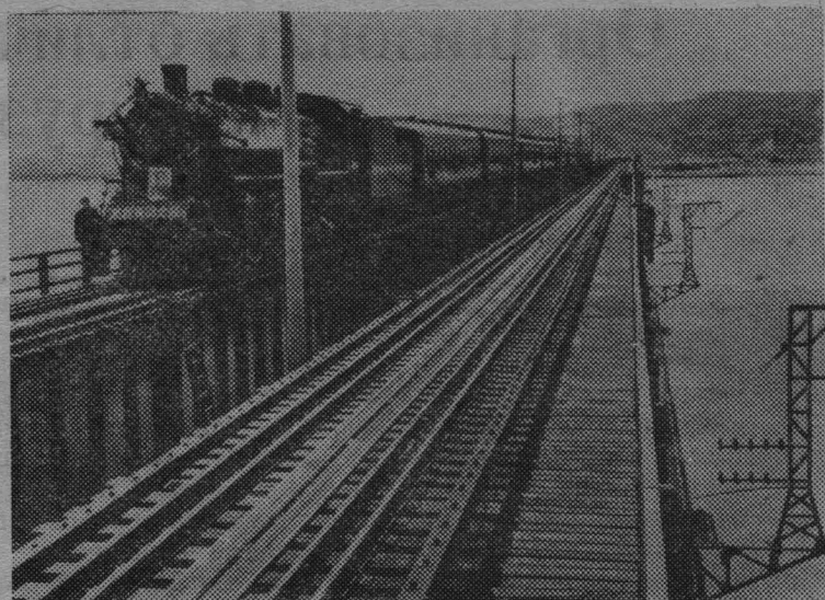
Китайская Народная Республика. Закончено строительство самого длинного в стране железнодорожного моста через реку Хуанхэ в провинции Хэнань. Строительство велось по проекту китайских инженеров. На снимке: первый поезд на новом мосту.