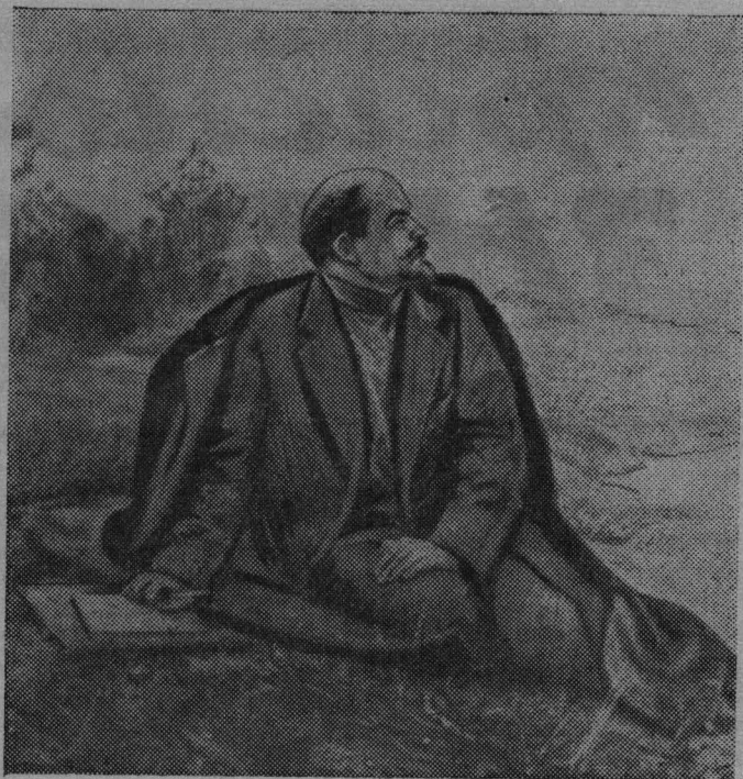
В. И. Ленин в Разливе