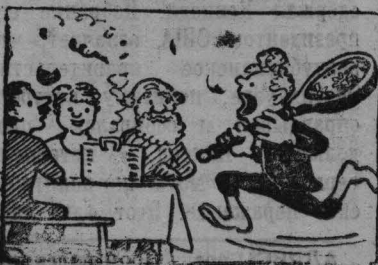
Зато ши хлебать — Не приходится звать!