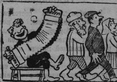
На работу у Федорки Всегда отговорки.

ЧЕЛЯБИНСК. В канун Великого Октября первая партия челябинских тракторов была отправлена еще в один из многочисленных зарубежных адресов — в адрес революционной Кубы. Горжественно алел над головами демонстрантов, проходивших по площади Революции, транспарант со словами приветствия революционной Кубе, ее героическому народу, Фиделю Кастро.