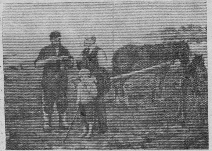
Картина художника П. Ф. Судакова «Разговор о земле».