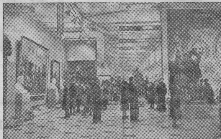
Москва. Всесоюзная художественная выставка в Центральном выставочном зале (бывший Манеж). НА СНИМКЕ: посетители осматривают выставку.