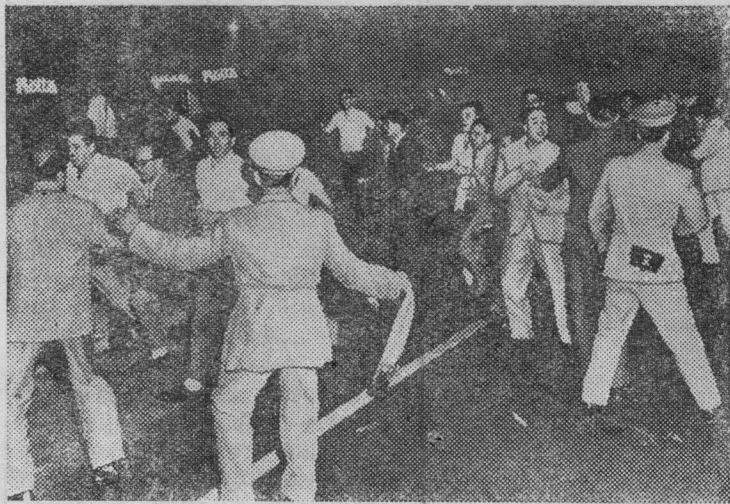
Трудящиеся Италии выражают протест против империалистической интервенции на Ближнем Востоке.

НА СНИМКЕ: полиция разгоняет участников демонстрации перед зданием посольства США в Риме. Демонстранты требовали немедленного вывода американских войск из Ливана.