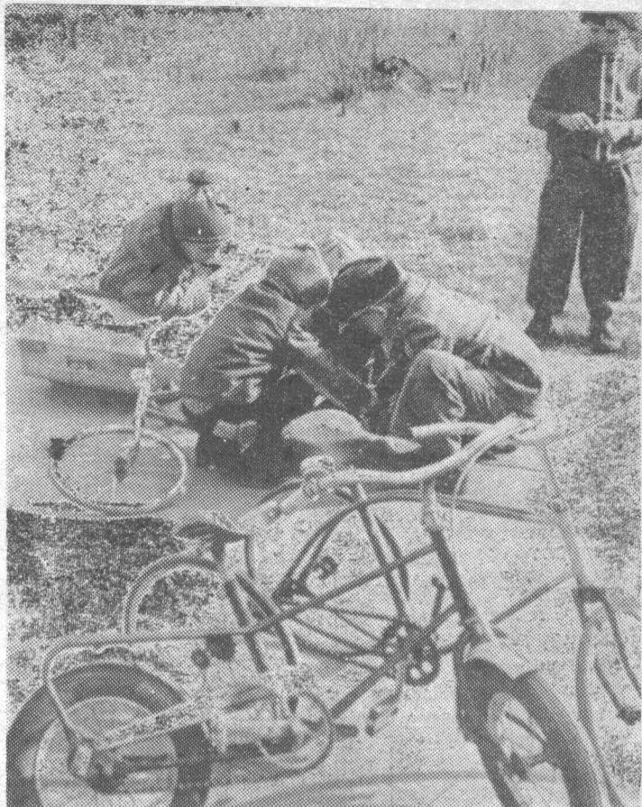
ВЕСЕННИЕ ЗАБОТЫ.