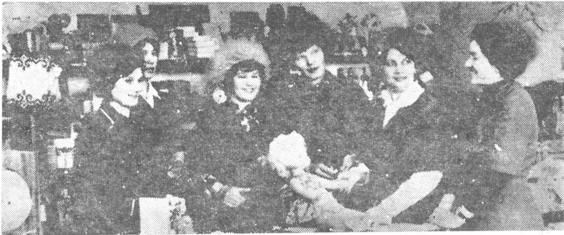
В Сидоровском совхозрабкоопе есть комсомольско-молодежная бригада продавцов. Девушки постоянно выполняют квартальные и годовые планы. Соревнуюсь с комсомольско-молодежной бригадой промтоварного магазина поселка

Чистогорска, они заняли за прошедший квартал первое место.