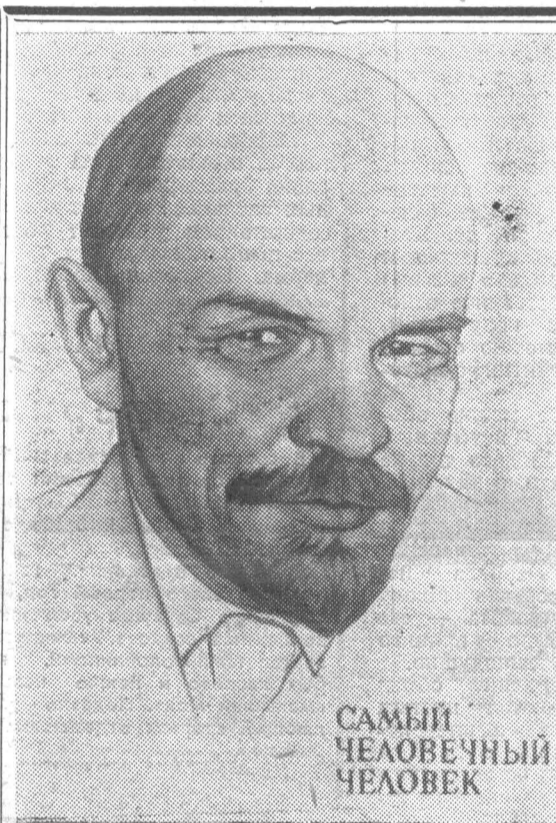
Плакат В. Березовского. Издательство «Плакат».

„Мы будем годы и десятилетия работать над применением субботников, их развитием, распространением, улучшением, внедрением в нравы. Мы придем к победе коммунистического труда!“