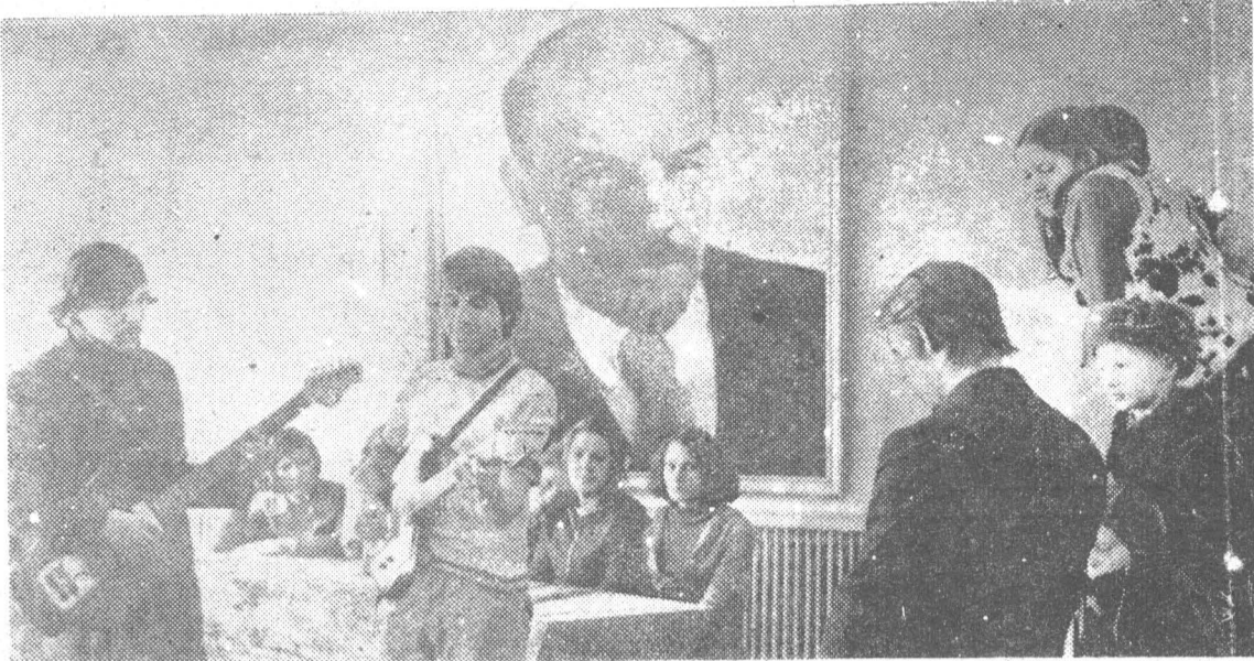
Большой популярностью у жителей села Красулина пользуется ВИА местного Дома культуры. На снимке: участники ансамбля на репетиции.