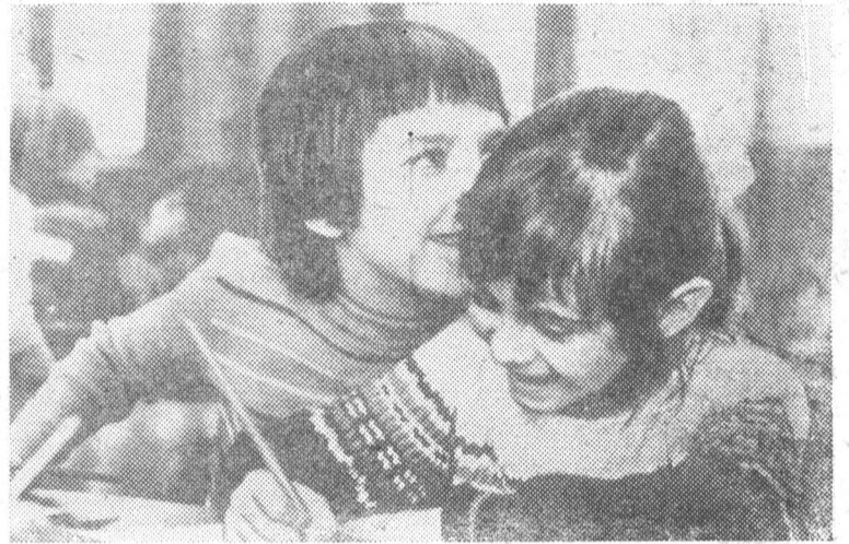
На снимках: маленькие чистогорцы; по секрету:

пиктограмма датского графика Эрика Йеррихау, признана лучшей среди 170 работ, которые были присланы на конкурс, стала официальной эмблемой 1979 года — Международного года ребенка, провозглашенного Организацией Объединенных Наций.