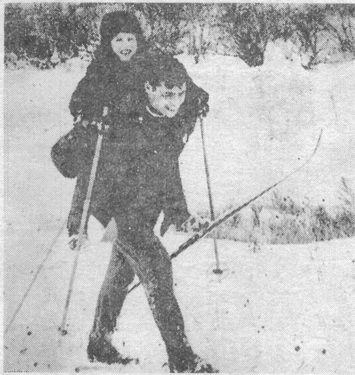
Хорошо кататься с папой!