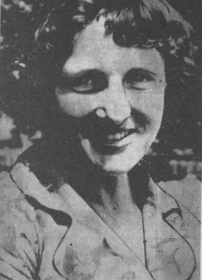
● ТВОЙ СОВРЕМЕНИК