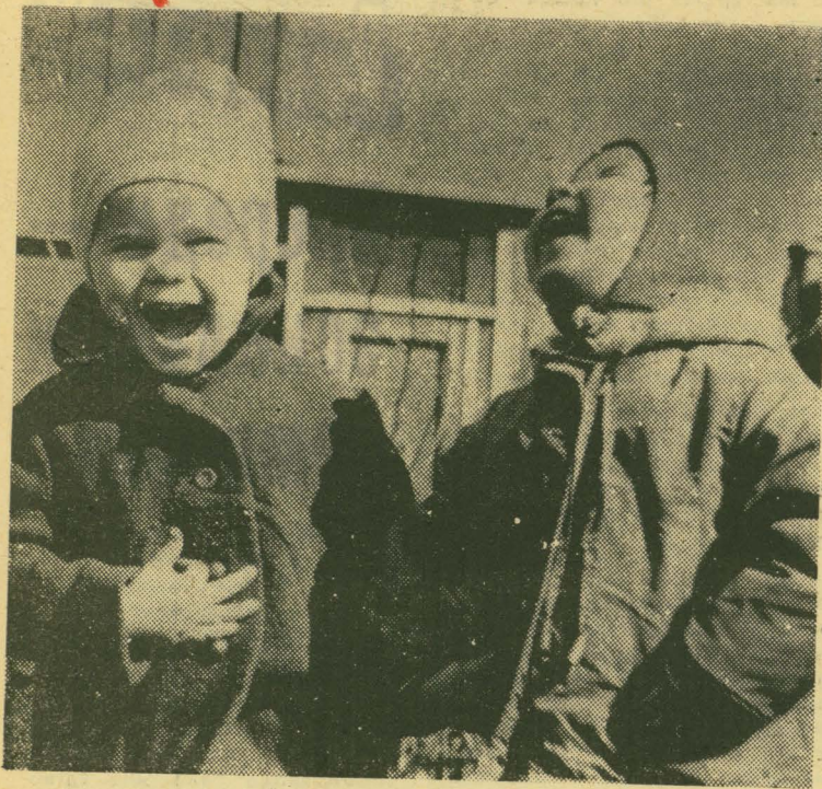
Мы радуемся солнцу.