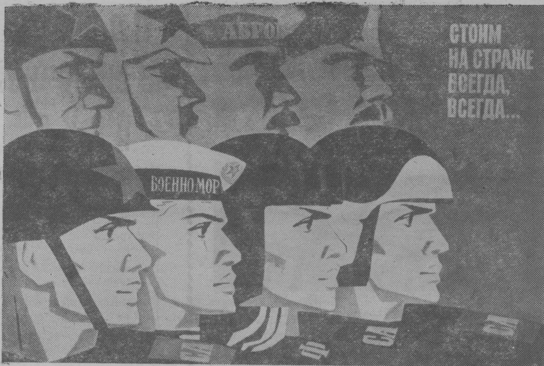
Плакат художника В. Кононова. Издательство «Плакат».