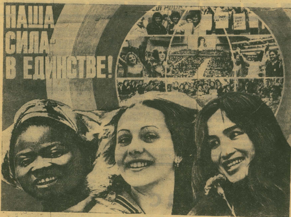
Плакат художника Ю. Фидлера.