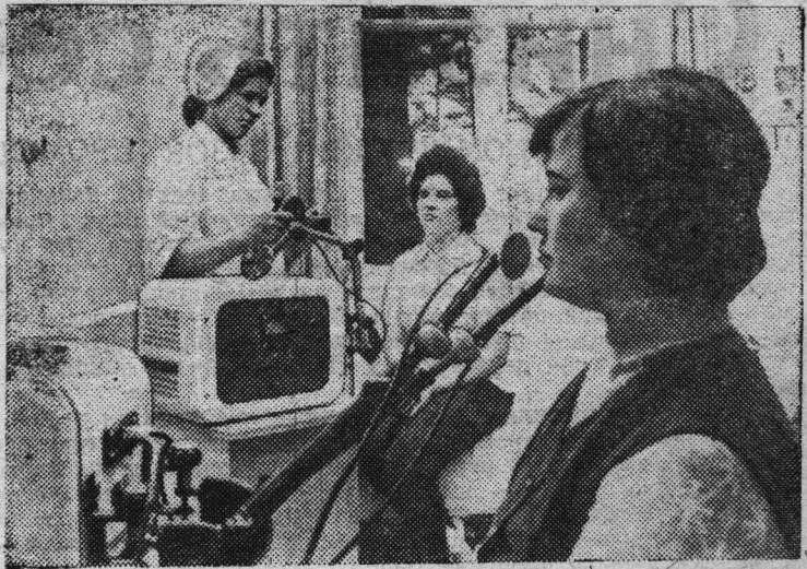
МОСКОВСКАЯ ОБЛАСТЬ. Клинский комбинат химического волокна ежегодно расходует на социально-культурные мероприятия около 700 тысяч рублей.

На эти средства построен и работает санаторий-профилакторий комбината. «Цехом здоровья» называют его труженики предприятия. 1800 человек в год отдыхают и проходят здесь профилактическое лечение, набираются сил и энергии.