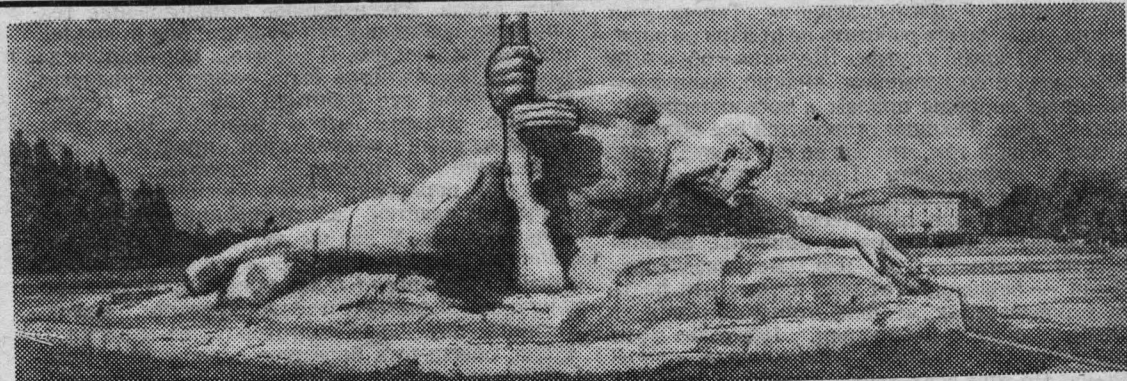
БРЕСТ. Подвику, совершенному защитниками города, посвящен мемориальный комплекс «Брестская крепость-герой». На снимке: скульптура «Жажда».

— Московское время — десять часов, — торжественно произнес диктор. — Всесоюзное радио продолжает свою работу...»