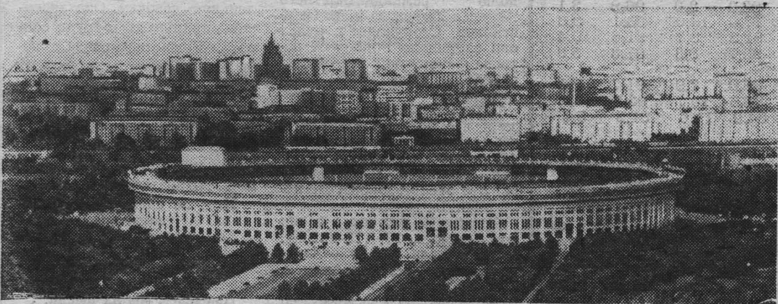
На проходившей в Вене 75-й сессии МОК принято решение провести летние Олимпийские игры 1980 года в Москве.

Волейбольная и баскетбольная команды сидоровских школьников — призеры многих районных соревнований. Недавно, готовясь к очередным спортивным сражениям, юные чемпионы провели товарищескую встречу со спортсменами Новокузнецкого индустриального техникума. Матч по волейболу выиграли студенты. Но побежденные не унывали — победа досталась друзьям.