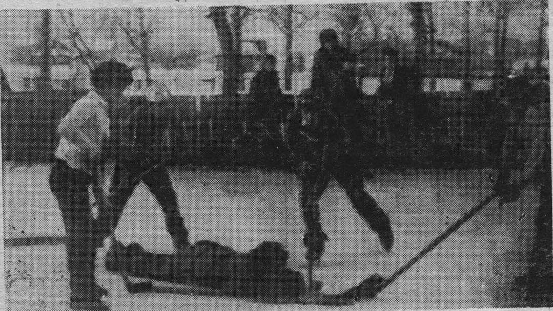
Шайбу! Шай-бу! На хоккейной тренировке ребята Ильинской средней школы.