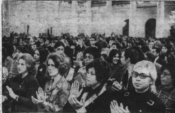
Москва. Участницы Всемирной встречи девушек в Колонном зале Дома союзов.