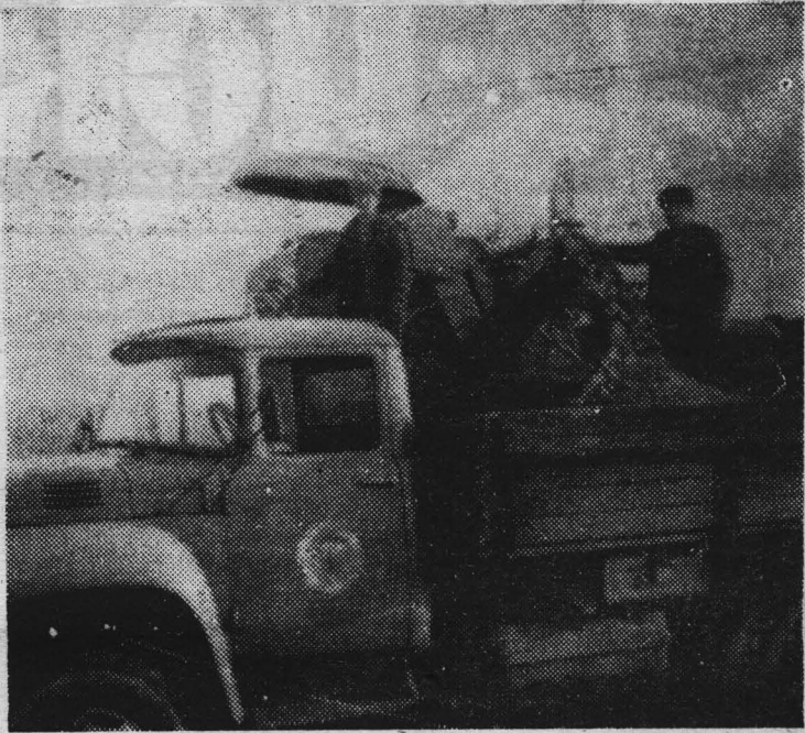
Последняя тонна зерна в совхозе «Кузедеевский».