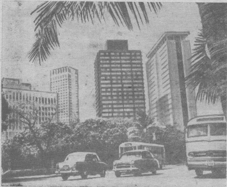
Индия. Бомбей — один из крупнейших городов мира, промышленный, торговый и культурный центр страны. Город небоскребов и пальм.