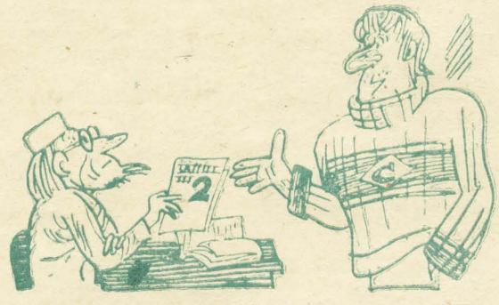
— Эх, профессор, видно, не дорожите вы спортивной честью института...