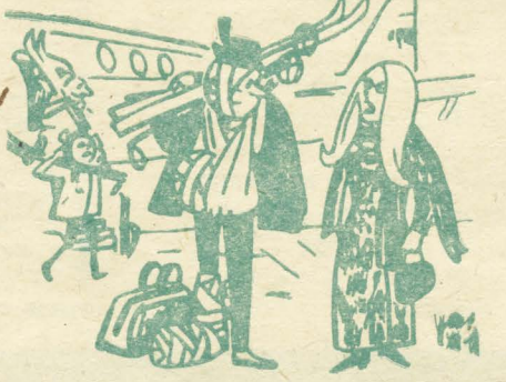
— Тебе повезло с отпуском. Мы все тут переболели гриппом...