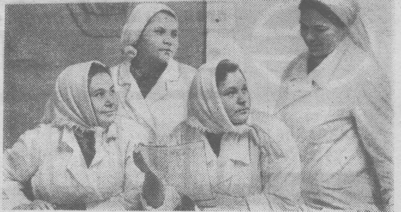
МОСКОВСКАЯ ОБЛАСТЬ. Высокие социалистические обязательства на 1973 год приняли животноводы подмосковного госплемзавода «Коммунарка». Коллектив животноводов решил в течение года продать государству 9900 тонн молока — на 10 процентов больше, чем в 1972 году.

На снимке: передовые мастера машинного доения Николо Хованской фермы.