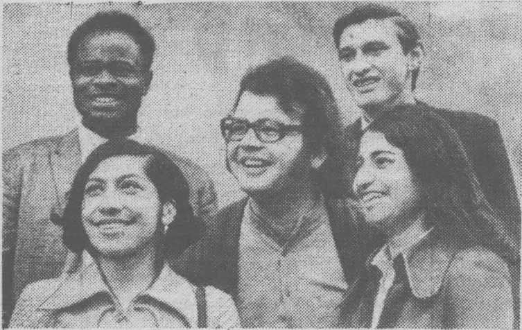
Москва. Около 5 тысяч студентов, аспирантов и стажеров из 86 стран Азии, Африки, Латинской Америки, Ближнего Востока, а также Советского Союза учатся в университете Дружбы народов имени Патриса Лумумбы.

Более 600 человек из развивающихся стран и 350 советских юношей и девушек стали студентами в этом году.