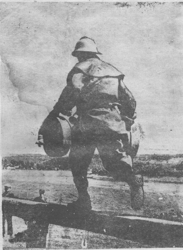
● СОРЕВНУЮТСЯ ДОБРОВОЛЬНЫЕ ПОЖАРНЫЕ ДРУЖИНЫ

— Трехкилограммовых карпов не обещаю, но чтобы через год в магазины Новокузнецка поступило не 26 тонн, а 36 тонн рыбы, постараемся сделать. Рыбакам верить можно. В. ШАТКИН.