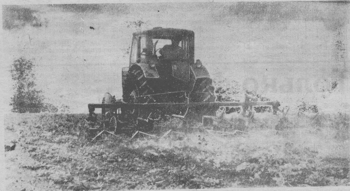
На снимке: обработка посевов картофеля в колхозе им. Димитрова.

Было принято постановление, в котором коммунисты районной партийной организации одобрили миролюбивый курс нашей партии.