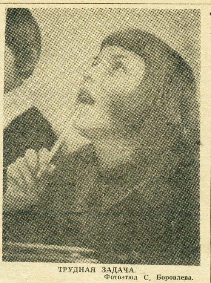
ТРУДНАЯ ЗАДАЧА.

И в кратких книжальных атаках, Сшибаясь с клинком о клинок, Он всей своей буйной отвагой Стоял за Советы, как мог. И как отраженые победы — Сверкал океан впереди. А было в ту пору деду Не более двадцати.