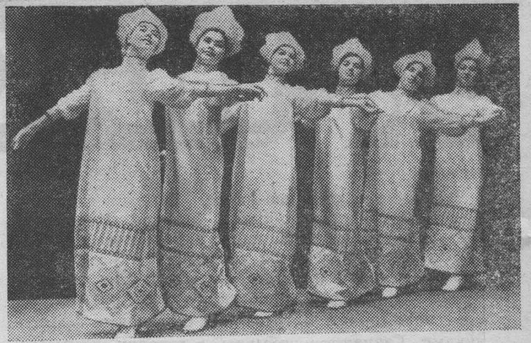
Тамбовское областное культурно-просветительное училище за годы своего существования подготовило 1400 работников сельских клубов и домов культуры. На снимке: учащиеся танцевального отделения исполняют танец «Весенний хоровод».