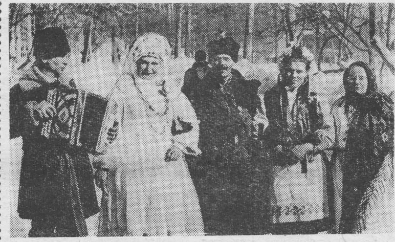
На снимках: 1. Кто мириться с присутствием и Весны, и Зимы. 2. Пока приходится Фото В. Полонского.

Этот традиционный русский праздник прошел в Таргайском доме отдыха.