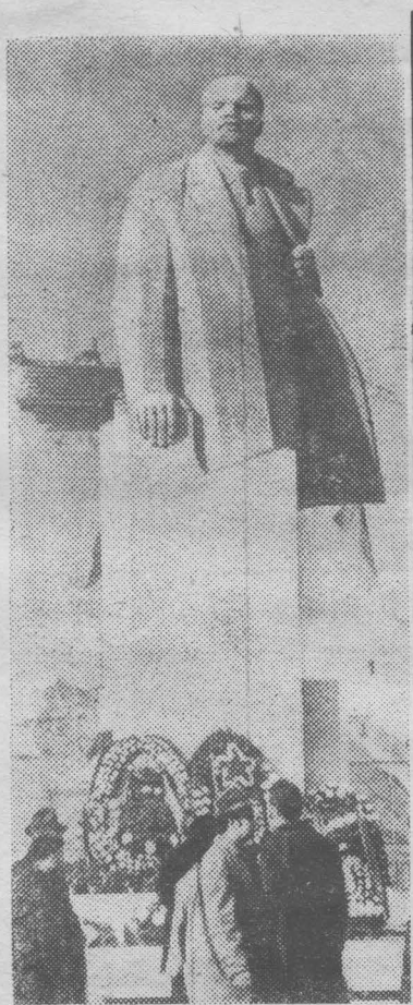
БОЛГАРИЯ. Недавно в Софии открыт памятник В. И. Ленину.