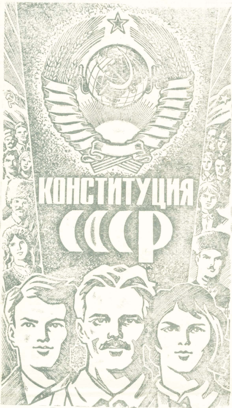
Плакат художника С. Гринько.