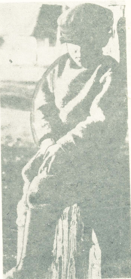
МУЖСКИЕ ЗАБОТЫ.

Вы соврали, пророки, И мы вам не простим. Пусть и потом, и кровью Мы платили за жизнь, Мы построим, построим На земле коммунизм. Как живые побег На нелегком пути Мы прожили полвека — И века вперед!