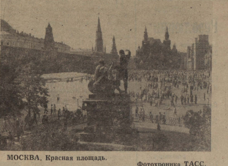
МОСКВА. Красная площадь.