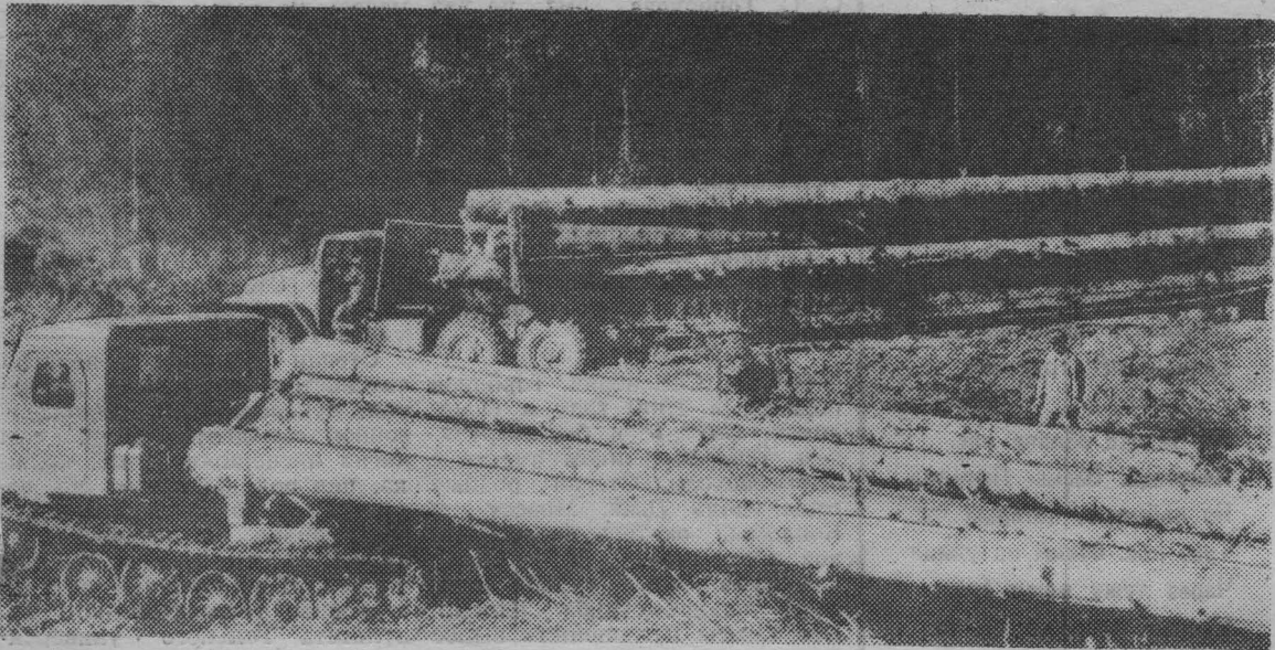
ЛЕС НУЖЕН СТРАНЕ