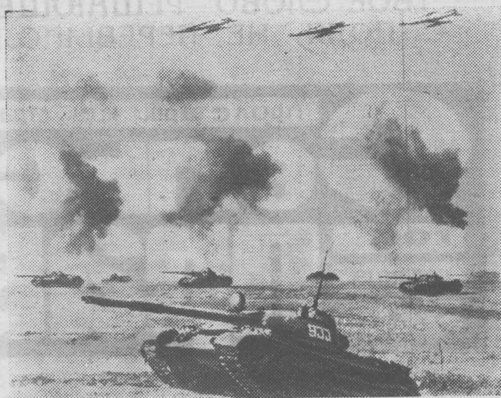
Будни Советской Армии. Воины армии совершенствуют боевое мастерство.

На снимке: учебная атака подразделения танкистов.