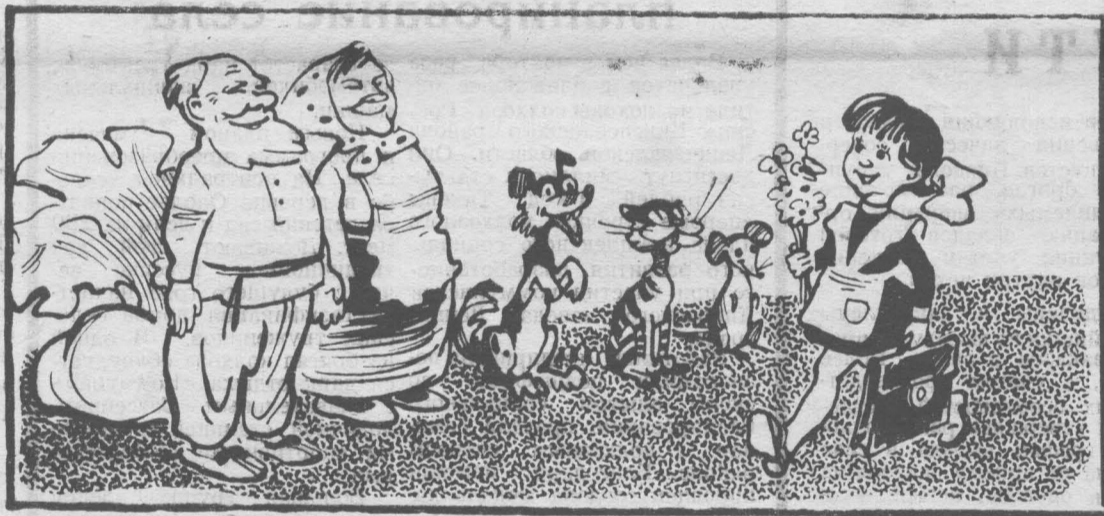
В первый раз в первый класс.