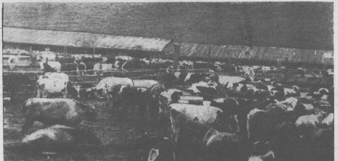
На откормочную площадку в колхозе «Вперед» поставлено 500 голов молодняка со средним весом 312 килограммов. Животноводы колхоза планируют сдавать скот весом более 350 килограммов. НА СНИМКЕ: общий вид откормочной площадки.

Н. ЕРМАКОВА, заведующая клубом пос. Новый Калтан.