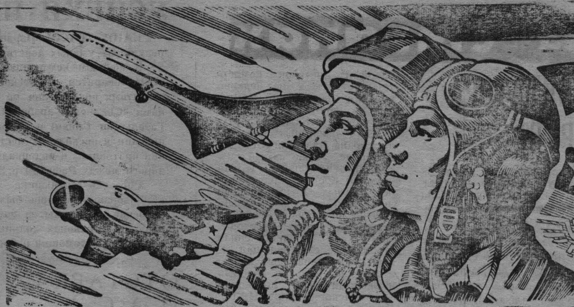
Рис. художника С. Гринько.