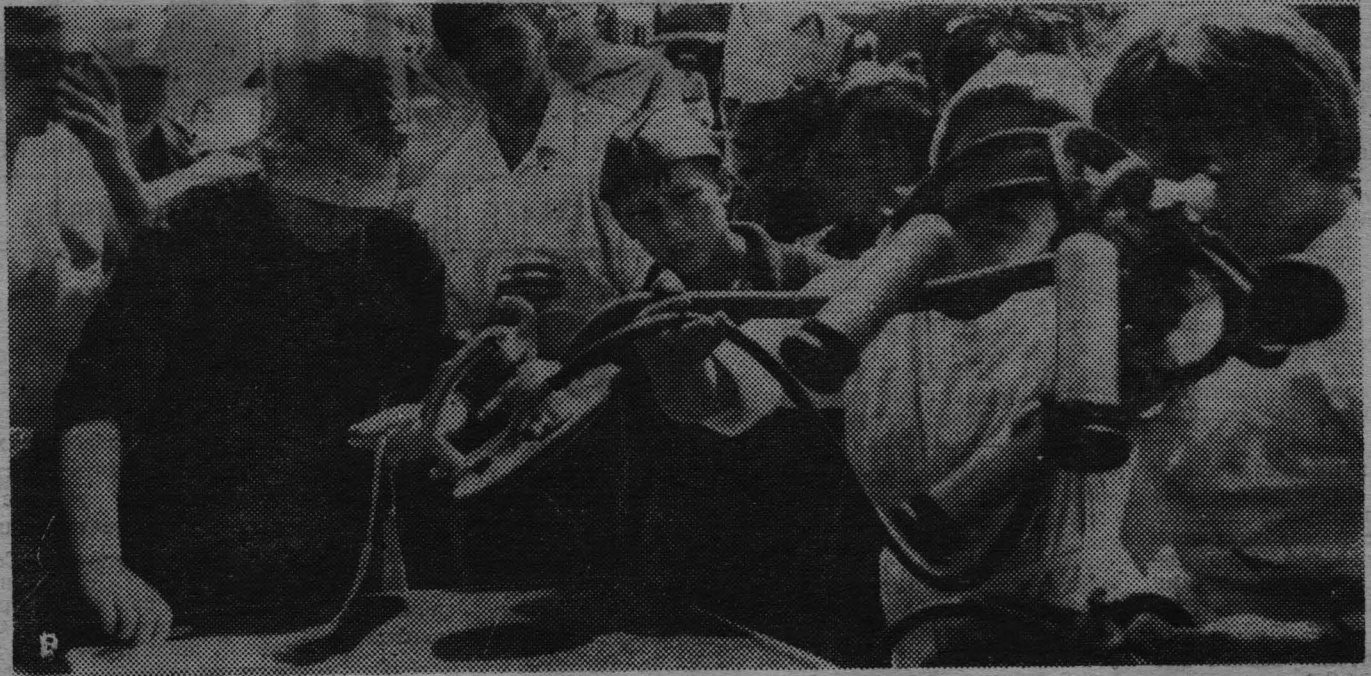
◆ Раз! Объявили о начале соревнований доярков. Два! Секундометрист начал отсчет времени. А на счет «три» уже надобно разобрать доильный аппарат. Но, как видно... «тяжела ты, шапка Мономаха».

В бирюзовую зелень деревьев вкраплены транспаранты с надписью «Привет участникам районного фестиваля молодежи!». Белеют торговые павильоны, шумит палаточный городок, громкоговоритель разносит над рекой мелодии популярных песен. Хмурилась погода. Но