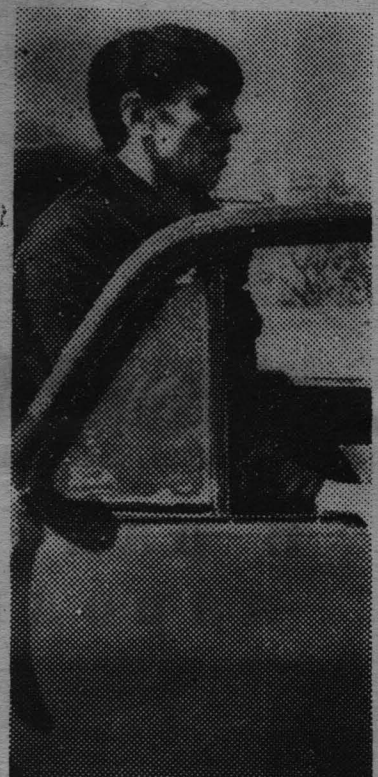
◆ Он еще не знает, что стал чемпионом района среди шоферов. Пройдя через все горнила испытаний, устало глядит на судей. Вскоре они объявят:

Медленно догорает костер, жаль расставаться с этим радостным днем. Стихает палаточный городок. Завтра фестиваль продолжится.