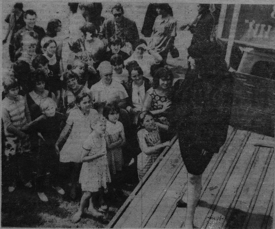
◆ Этот снимок в комментариях не нуждается. Посмотрите, с каким вниманием следят зрители за манекенщицами.