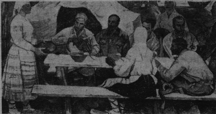
МИНСК. В Государственном художественном музее Белоруссии экспонируется выставка «50 лет ВССР и КПБ». На ней представлено 600 произведений живописи, скульптуры, графики, декоративного и прикладного искусства.

Нынешний год начался с трудностей. Перед коллективом встала серьезная задача: не сорвать план. Было плохо с транспортом, мешало бездорожье. Сейчас кризис миновал. Очередная партия мебели, поступившая недавно в магазин, частые поездки заведующей на базу, наконец, листок с надписью «поступил в продажу...» — все это обернется лишним процентом в графе «выполнение плана». Коллектив настроен по-боевому. Взятые личные обязательства в честь 100-летия со дня рождения Ленина. Выпильте их — вот главная забота. В. СТАРШИНОВ.